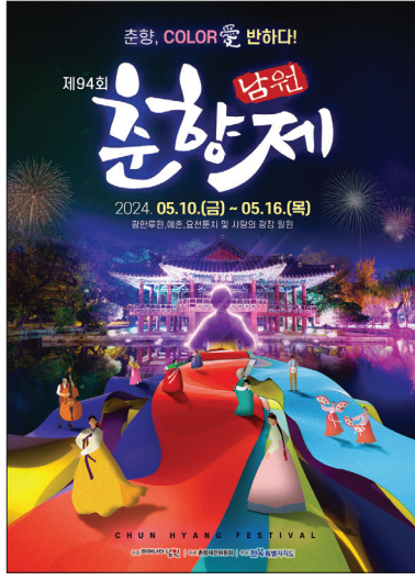
제94회 춘향제 포스터

향, 예술인들의 합동공연, 콘서트, 불꽃축하쇼 등으로 분위기를 한껏 끌어올릴 예정이다. 또한 춘향제 기간에 맞춰 합인행사를 진행하는 춘향 페스타로 쇼핑의 경험을 더욱 즐겁게 만들어, 지역 상권 연계 프로그램을 통해 관광객에게 다양한 합인 혜택을 제공할 뿐 아니라, 체험쿠폰, 지역화폐 등으로 지역 상인들의 상권활성화를 도모하며 모두가 만족할 수 있는 축제를 준비할 것이라고 전했다. 특히 남원시는 이러한 고도화된 콘텐츠와 확대된 프로그램들로 제94회 춘향제 목표 방문객을 100만 명으로 설정, 이를 통해 남원시 전라도권을 넘어 전국구 축제로 도약하는 발판을 마련하고 6년 후인 100회에는 글로벌 축제로 거듭날 수 있도록 다양한 분야의 전문가와 함께 축제 프로그램을 연구하고 개발하겠다고 밝혔다. 최경식 남원시장은 "올해도 시민과 함께 준비하고 만들어 가면서 더욱 성장하고 신명나는 춘향제가 될 수 있도록 더욱 노력하겠다"고 밝혔다. /남원=김기두 기자