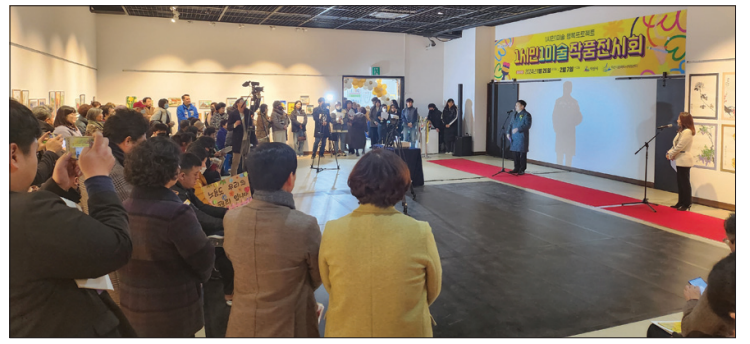
익산시와 익산시문화도시지원센터는 2월 7일까지 '1시민 1미술 프로젝트' 작품전시회를 슐리문화예술회관 2층 전시실에서 개최한다.