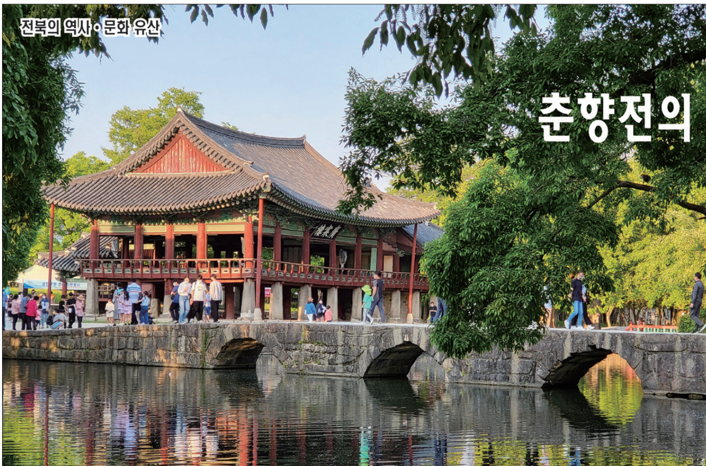
전북의 역사·문화 유산

을 함께 수록하여 체계적이고 일관된 수업 계획을 돕는다. 방대한 요가 철학을 녹여낸 54가지의 다채로운 수업 주제와 함께 명상을 돕는 노래, 시, 인용구는 물론 주제를 소화하기에 적합한 아사나, 수업의 각 단계에서 강사가 사용하기 좋은 표현들까지 제공한다.