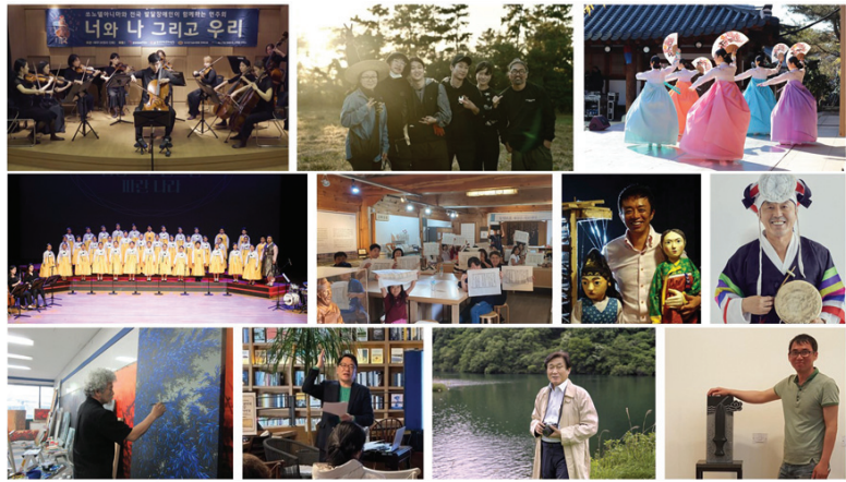
전북문화관광재단은 제1회 전라북도 예술·관광상 수상자로 예우 등 11건을 선정했다.