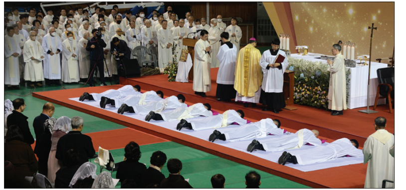
전주교 전주교구 사제·부제 서품식 2024년 전주교 전주교구 사제·부제 서품식이 열린 11일 전주실내체육관에서 서품 받는 사제와 부제들이 전북 기도를 올리고 있다. 전북 기도는 세상에서 가장 낮은 이가 되어 하느님을 경배하겠다는 다짐을 상징한다.