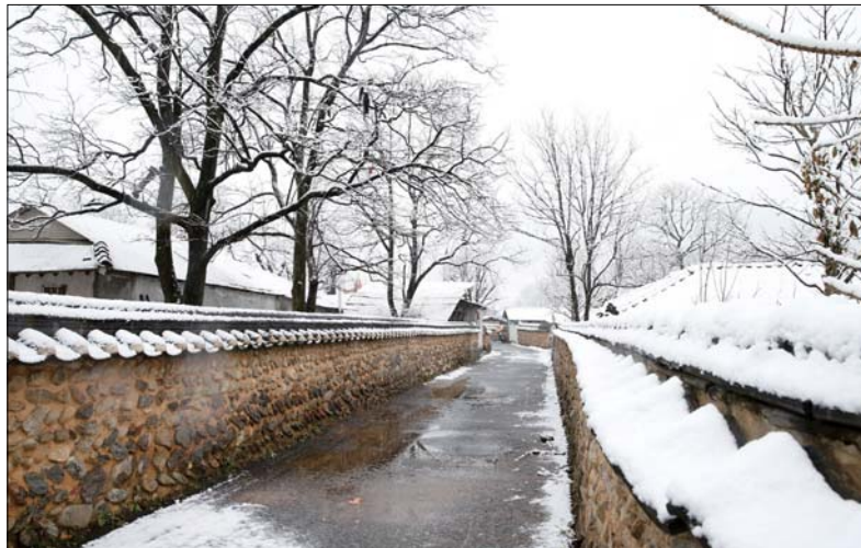
무주군이 국비 5,500만 원을 확보하면서 문화재청이 실시하는 국가등록문화재인 설천 지전마을 옛 담장 기록화사업을 추진한다.