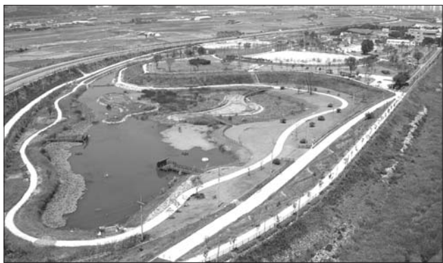
남원시가 요천생태습지공원 내 애견 놀이공원을 조성할 계획이라고 밝혔다.

남원시 관내에는 2,000여명의 애견인과 반려견 560여 마리가 등록되어 있다. 그러나 반려견과 함께 할 수 있는 안전한 야외 운동시설이 전무한