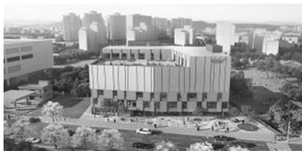
김제시 검산동 복합건축물 조감도

지상5층의 규모로 4층에 4관 416석의 영화관(CGV)과 근린생활시설, 운동시설 등이 들어설 것으로 계획됨에 따라 인근 홈플러스와