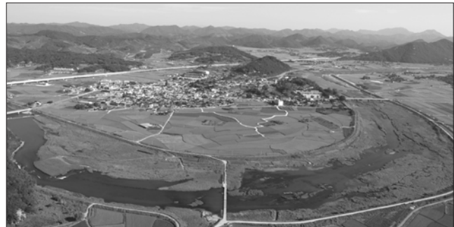
완주군은 만경A권역의 수질을 높이기 위해 가축분뇨 우분연료화사업과 가축분뇨공공처리장 개선사업등을 추진한다.