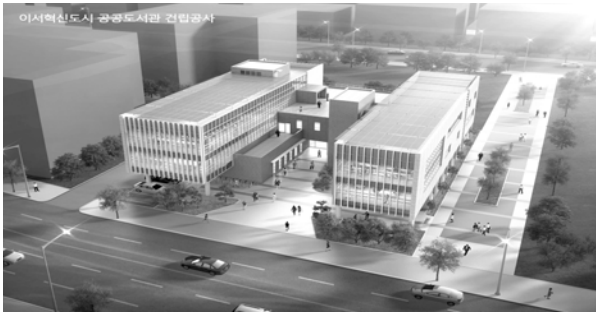
완주군 이서혁신도시내 조성하는 공취팔취도서관 조감도

이번 공모사업에는 전국 34개관이 신청해 1차 서류 및 2차 발표심사를 거쳐 공취팔취도서관을 비롯해 총 10개관이 선정됐다. 완주군립 공취팔취도서관은 '여행·과학'을 특화 주제로 사업에 선정돼 1500만원이 지원된다.