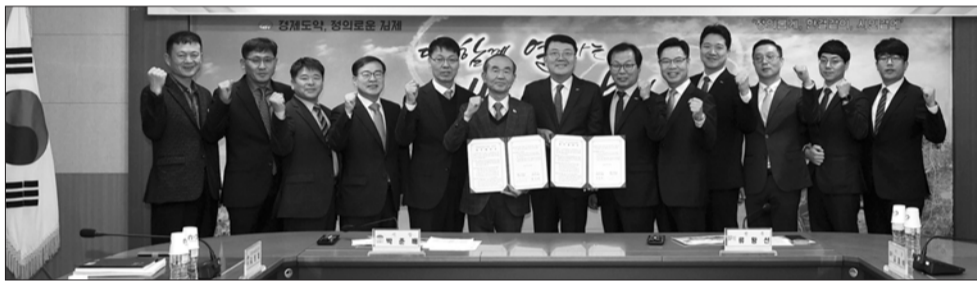
김제시는 12일 시청 2층 상황실에서 BGF리테일과 공동 홍보·마케팅 업무협약을 체결했다.

그 무엇보다 아닌 인간 중심의 디자인이 되어야 한다"며 "낙후된 도시를 재생하고, 인구가 소멸해 가는 농어촌을 가꾸고, 범죄의 위험성에 노출돼 있는 곳을 개선하는 그 모든 노력의 중심에는 반드시 인간의 행복이 최우선의 가치로 고려되어야 한다"고 강조했다. 이어 "군민들이 실생활에서 체감할 수 있는 보다 나은 삶, 최적의 환경 실현에 최선을 다하겠다"고 말했다. 한편, 완주군은 공공디자인 활성화 및 도시미관 향상을 위해 지난 2016년 경관디자인팀을 신설한 후 완주군의 공공디자인 정책을 역점적으로 추진하고 있으며, 문체부의 '공공디자인'으로 행복한 공간만들기, 행자부의 '좋은 간판 나눔 프로젝트' 등 국가공모사업에 선정되는 등 지속적인 성과를 거두고 있다. /완주=이종복 기자