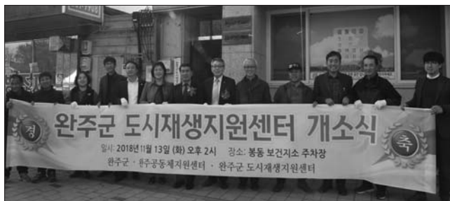
완주군은 13일 봉동읍 보건지소 공영주차장에서 '완주군 도시재생(현장)지원센터' 개소식을 가졌다.