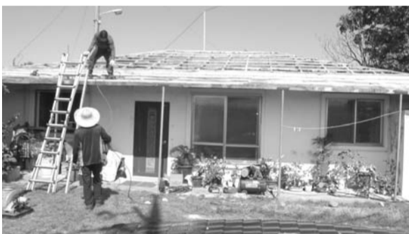
완주군이 2006년부터 '나눔과 희망의 집 고쳐주기 사업'을 시행하고, 현재까지 약 700세대에 사업을 완료했다.

대상자 선정은 3년 이내 희망의 집 고쳐주기 사업 및 타 집수리 사업을 받지 않은 가구를 우선순위로 지정하고 있으며 이미 지원받은 경우에는 지원받지 않았던 항목에 대해서만 지원이 가능하다.