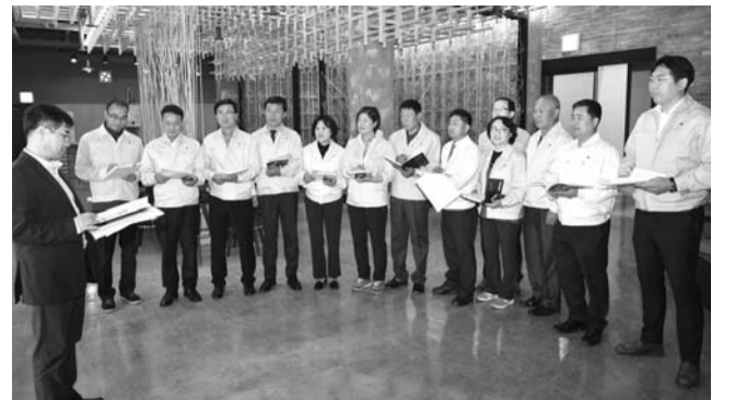
완주군의회의는 제234회 임시회를 맞아 자치행정위원회, 산업건설위원회 총 11개소의 사업장 및 기관을 방문했다. 사진은 완주문화재단 현장 방문.