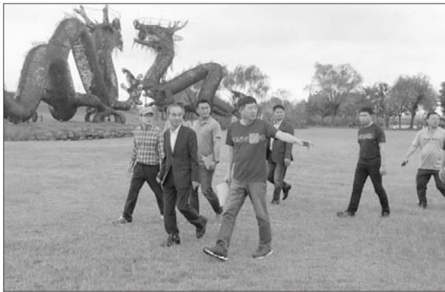
박준배 김제시장은 추석 연휴기간 제20회 김제지평선축제의 완벽한 축제장 조성을 위해 벽골제를 방문했다.

박준배 김제시장, 현장 방문 무대·체험부스 등 점검 완료 완벽한 축제장 조성 당부