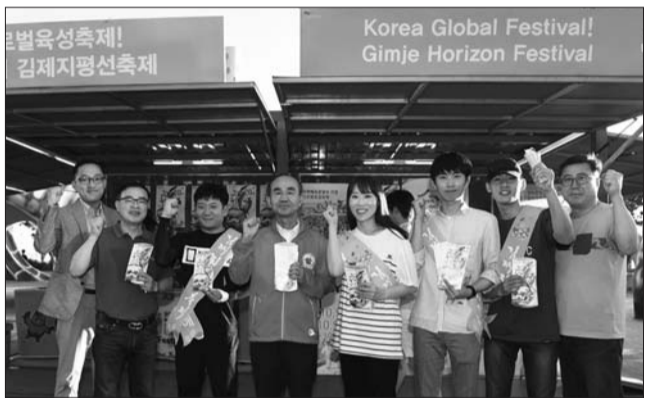
박준배 김제시장이 지난 14일 충남 보령 머드축제 행사장을 방문해 지평선축제의 세계화를 위한 벤치마킹을 벌였다.

김제시는 지난 13일부터 15일까지 3일간, 충남 보령 머드축제 행사장에서 열린 '2018년 글로벌축제 관광박람회'에 참가해 '김제시 홍보관'을 운영, 국내외 관광객을 대상으로 문화관광체육부 지정, 대한민국 글로벌 육성축제 제20회 김제지평선축제를 홍보했다.