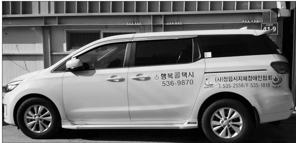
정읍시 행복 콜택시가 주 7일로 확대 운행됨에 따라 그동안 평일 아간시간대와 일요일 운행되지 않아 초래했던 불편을 덜 수 있게 됐다.

또 설 명절기간 운영된 공공보건기관, 병·의원, 약국 등의 명단은 부안군청 홈페이지(www.buan.go.kr)와 119 안내 콜센터로 전화하면 가까운 진료기관을 안내 받을 수 있다. /부안=이옥수기자