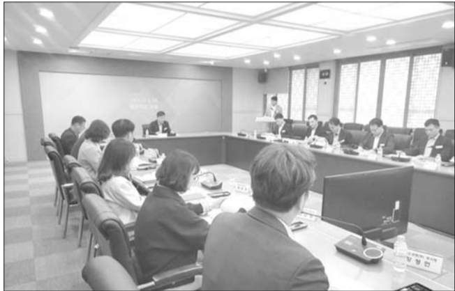
김제시는 지난달 29일 시청 대회의실에서 '김제시 전략산업 발굴 방안 연구용역'의 최종보고회를 개최했다.