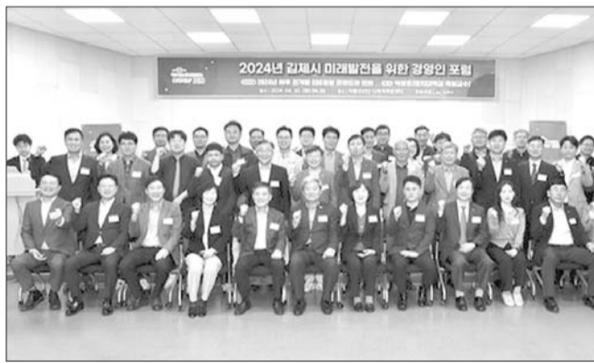
김제시는 지난달 30일 오전 7시 지평선 산업단지 다목적복합센터에서 '2024년 제1회 김제시 미래 발전을 위한 경영인 포럼'을 개최했다.