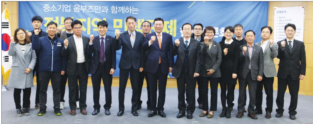
중기 옴부즈만과 함께하는 민생규제 현장토론회

전북도는 4일 전북도청에서 '중소기업 옴부즈만과 함께하는 전북지역 민생규제 현장토론회'를 공동개최했다. 이날 토론회는 지역경쟁력 및 지방자치 활성화를 위해 중소기업 옴부즈만과 함께 기업 애로사항 해소를 청취하고, 중앙부처 관계자와 개선방안을 토론했다는 자리로 건의과제 19건(현장건의 7건, 서면건의 12건)이 논의되었다. 사진은 참석자들이 화이팅을 하고 있는 모습.