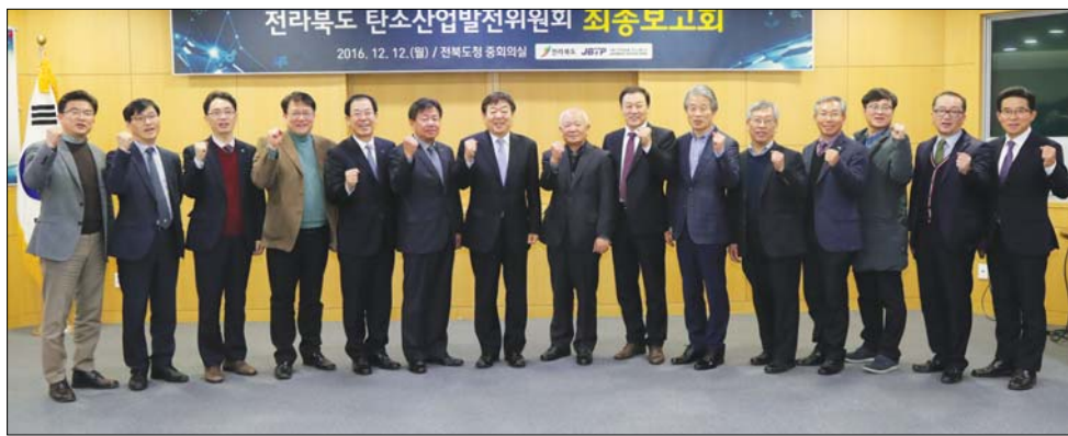
탄소산업발전위원회 최종보고회 12일 전북도청 중회의실에서 열린 전북 탄소산업 발전위원회 최종보고회에 진흥정무부차관과 국내 탄소기업, 연구기관 학계, 전문가 등 30여명이 참석하여 지난 1년간 발굴한 총14개의 정책과제 최종보고회를 갖고 있다. <관련기사 2면>